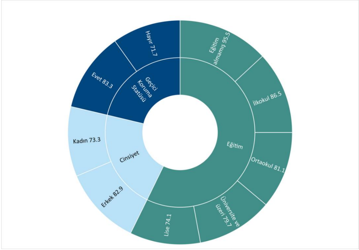
ŞEKİL 3: İşgücü piyasası ile ilişkili ayrımcılık

Kaynak: İYF İşgücü Araştırma Anketi, 2017