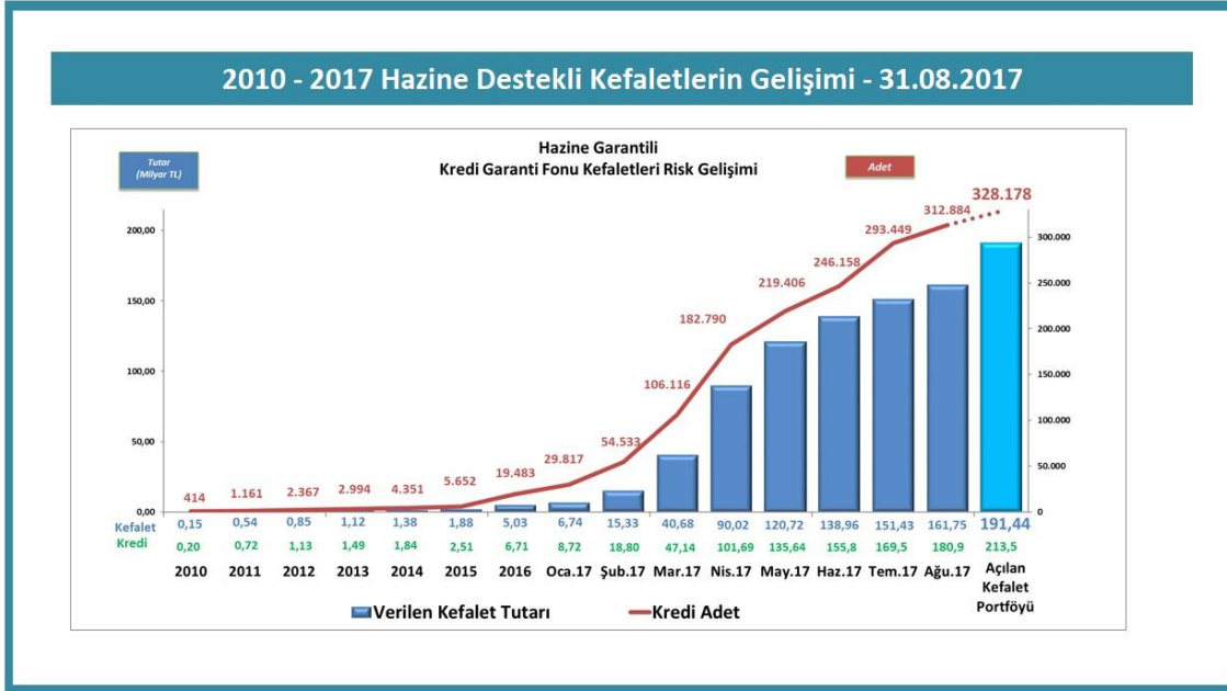
Ek Şekil 1. 2010-2017 Hazine destekli kefaletlerin gelişimi

Kaynak: KGF, http://www.kgf.com.tr/index.php/tr/bilgi-merkezi/rakamlarla-kgf