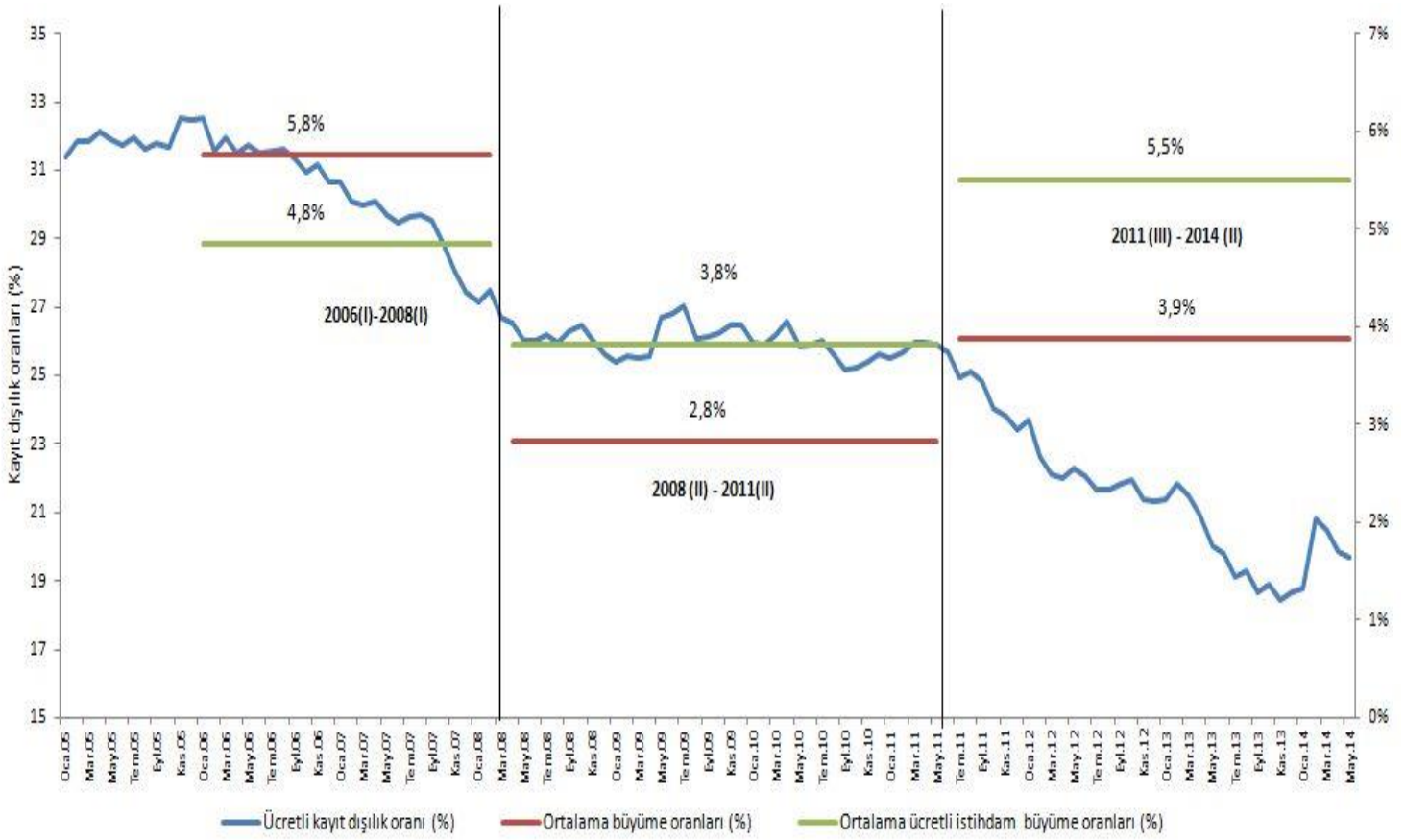
Şekil 2: 2005 ve 2013 Büyüme, ücretli istihdam artışı ve kayıt dışılık oranları (mevsimsellikten arındırılmış) 5